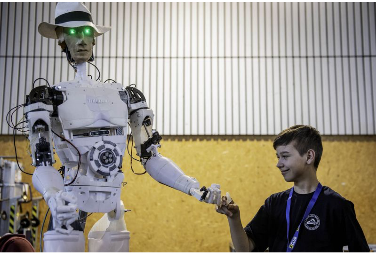
Sehr begehrt war der "Inmoov" bei den Teilnehmern des Robo Cups in Weiz

Übrigens: auch der 3. Platz ging an die HTL Weiz . Mit ihrem Rubik-Würfel-lösenden Roboter konnten die Schüler der 1. und 2. Klasse Informationstechnik punkten und durften sich über einen Stockerlplatz freuen.