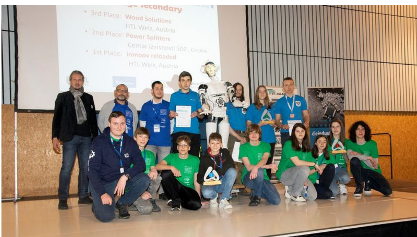
Erster und dritter Platz: Die beiden Teams der HTL Weiz standen am Stockerl