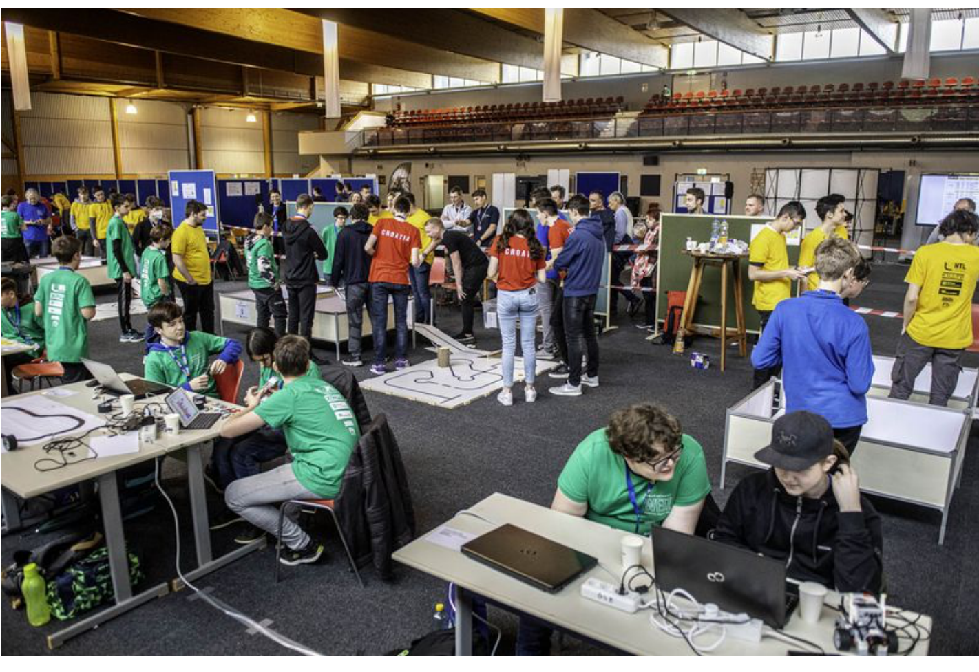
Die Stadthalle Weiz verwandelte sich einen Tag lang in die Robotik-Hochburg Österreichs